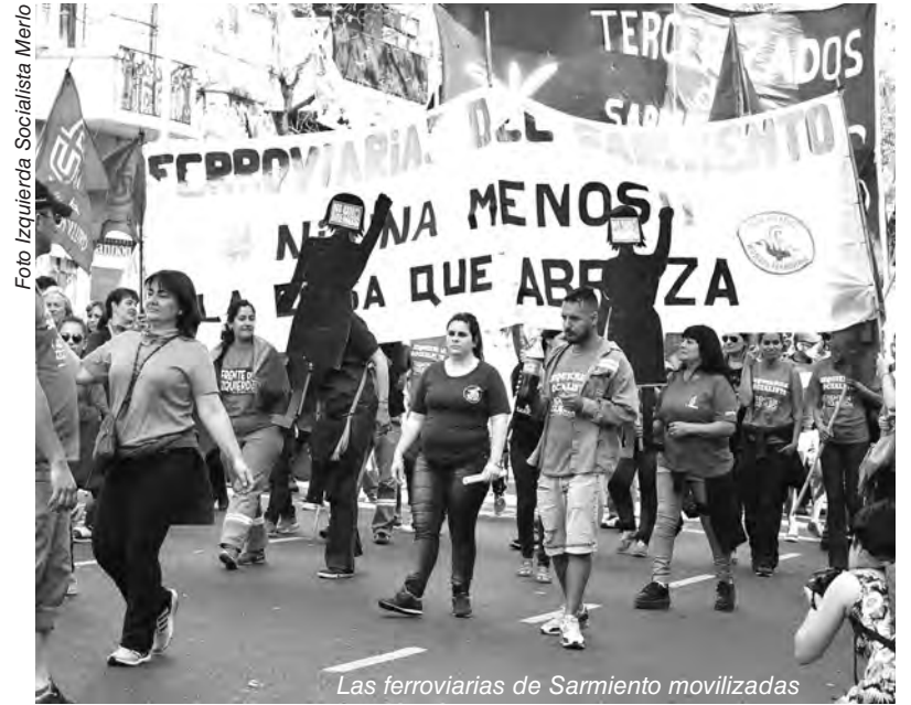
Las ferroviarias de Sarmiento movilizadas