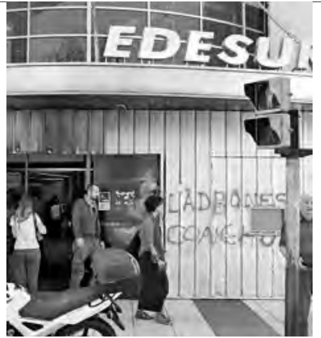
Grafiti en sede de Edesur diciendo "ladrones"

Estas empresas, que llevan 25 años brindando pésimos servicios y burlándose de los usuarios, son premiadas con tarifazos astronómicos, dolarización de las tarifas desde el año próximo, dos aumentos semestrales garantizados y ahora el perdón de sus millonarias deudas. Lo dijimos en la audiencia pública: Edenor, Edesur, Edelap y todas las privatizadas ya demostraron que lo único que les interesa es llevarse sus superganancias. La luz eléctrica es un servicio público esencial, un derecho humano que no puede ser tratado como una mercancía. La única salida para garantizar realmente tarifas accesibles para todos y servicios de calidad pasa por la rescisión de todos los contratos de concesión y la reestatización del servicio, gestionado por quienes realmente saben del tema, sus propios trabajadores y las organizaciones de usuarios.