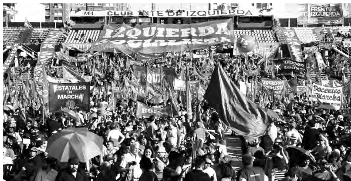
Vista parcial del acto