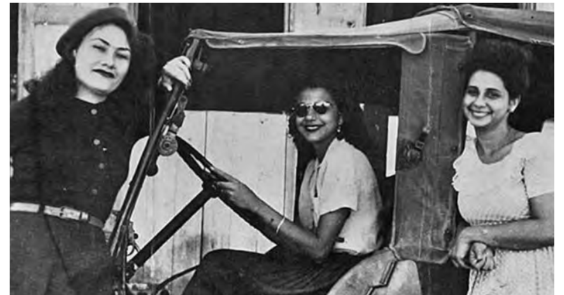
Patria, Minerva y María Teresa Mirabal, las hermanas dominicanas

para sobreexplotar a las mujeres trabajadoras. Los femicidios, los golpes, las violaciones y demás formas de violencias son parte de una política de disciplinamiento constante para todas las mujeres que garantizan la dominación del capitalismo patriarcal.