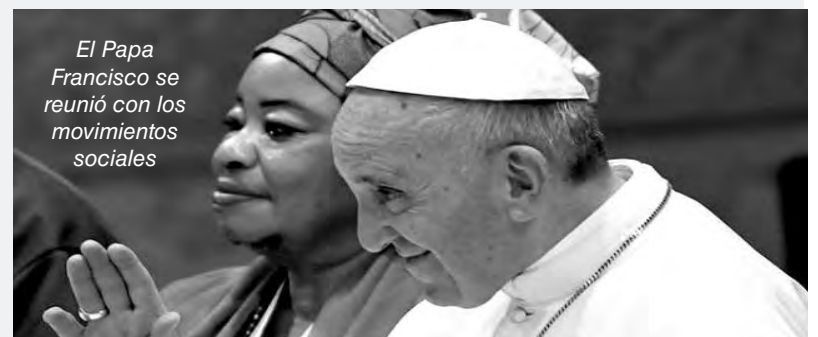
El Papa Francisco se reunió con los movimientos sociales

Pero también el Papa Francisco participa y es parte de un recambio