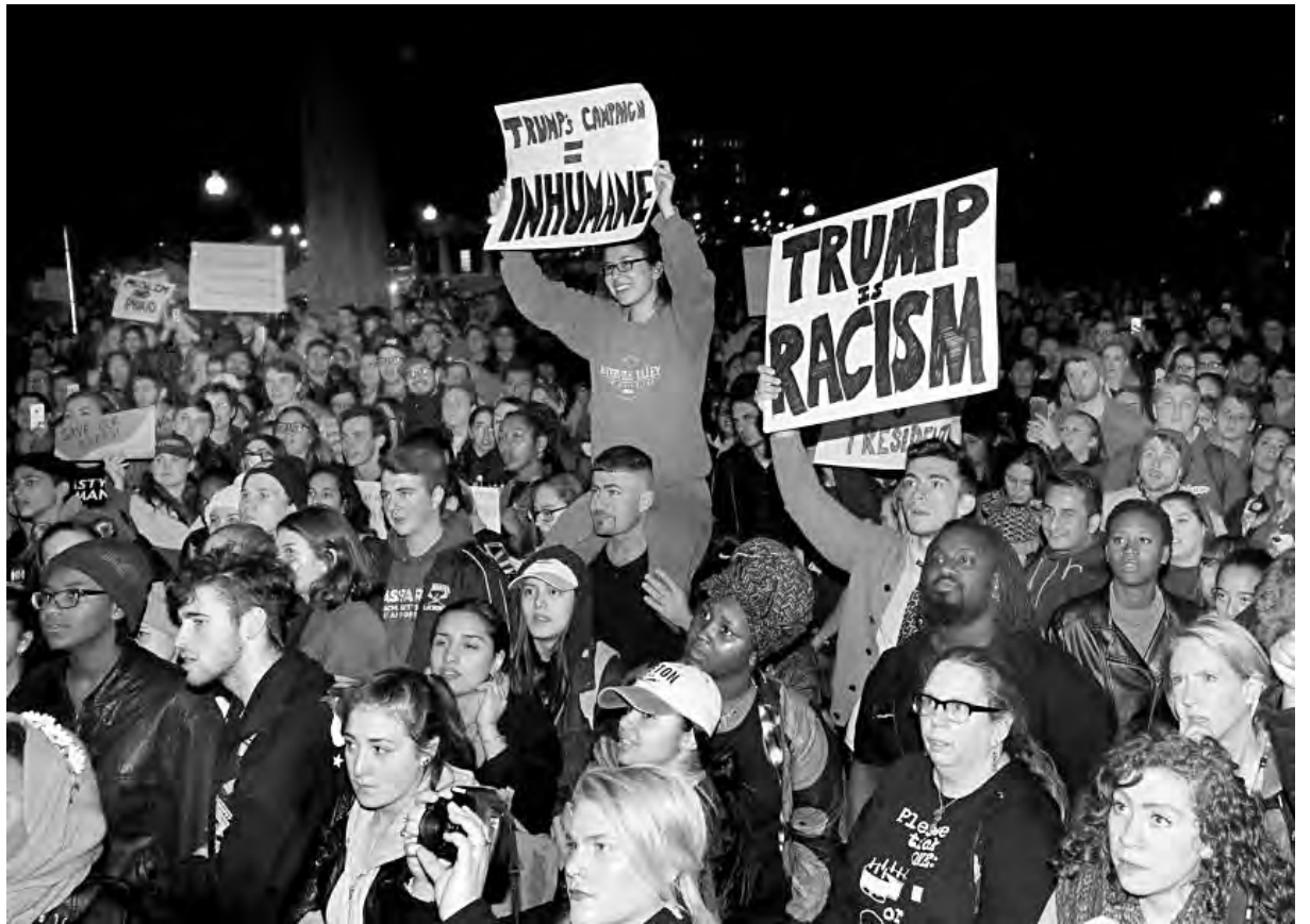
Luego de la elección, miles de jóvenes salieron a repudiar el racismo de Trump

ministro húngaro, Viktor Orban, Marine Le Pen del Frente Nacional Francés, Nigel Farage del Ukip británico, Gert Wilders de Holanda, y los neonazis de Amanecer Dorado de Grecia, todos celebraron. El jefe sionista, Benjamin Netanyahu, felicitó efusivo a Trump. El parlamento ruso ovacionó a Trump y Putin envió felicitaciones.